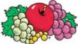
Fruit of the Loom