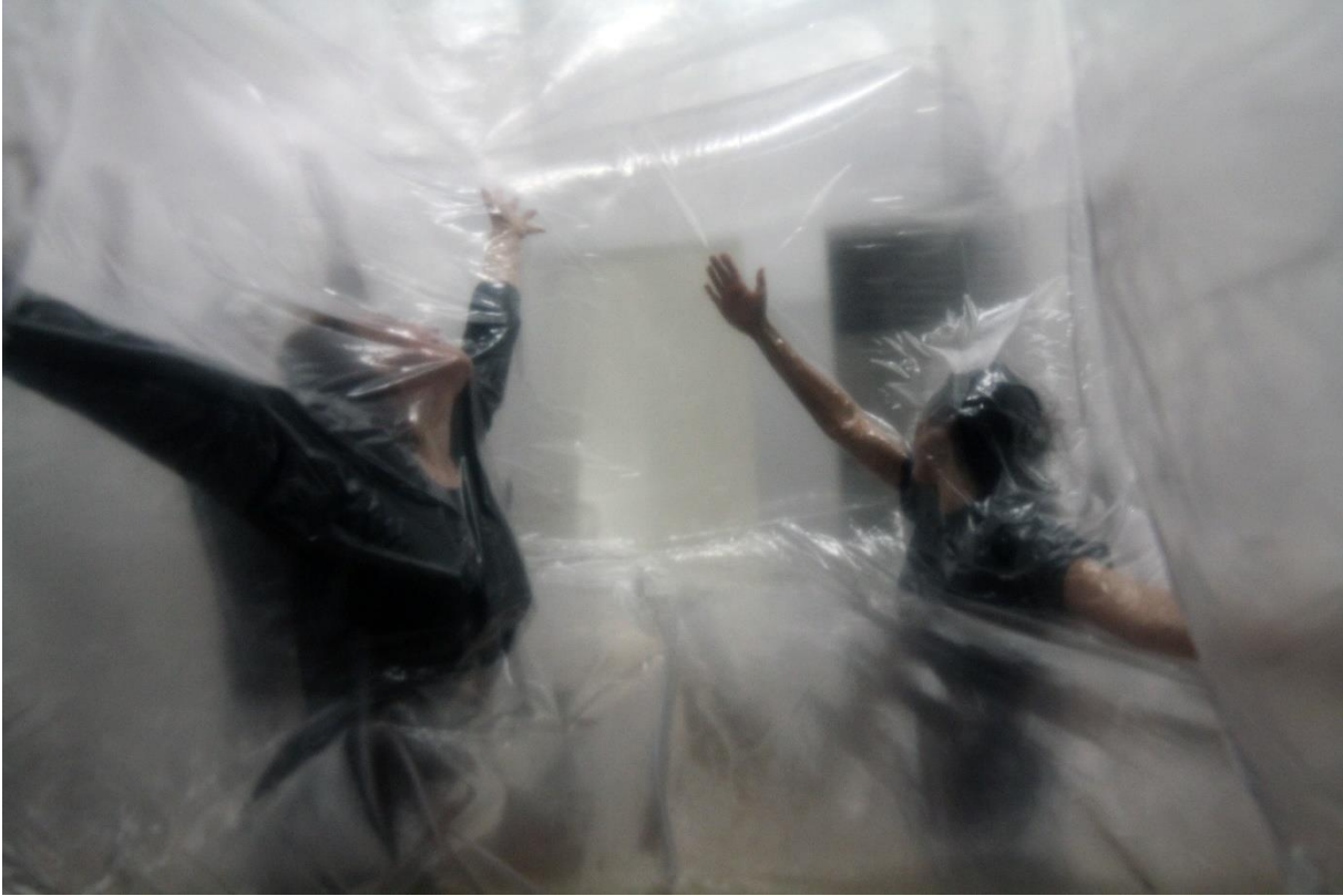
Lukas Fries_Block, 2021, Raumintervention